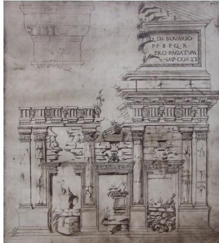
Giuliano da Sangallo, Dessin de l'angle occidental de la Basilique Aemilia et chapiteau dorique du Forum Boarium, Codice Vaticano Barberiniano Latino 4424, f.26